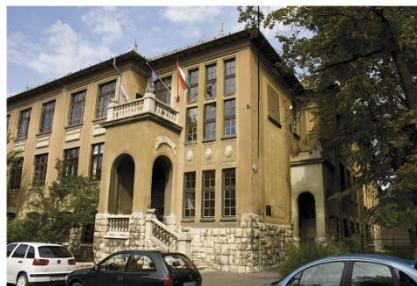
Szakiskola Petőfi utca 72.