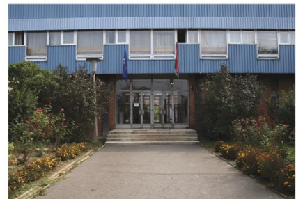
Tanműhely Martyn Ferenc utca 4.