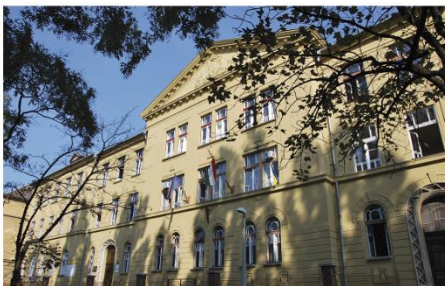
Központi épület Rét utca 41-43.